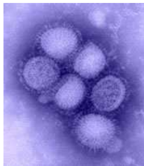
Imagen del virus de la influenza Tipo A H1N1 tomada en el laboratorio de influenza del CDC.

Este virus en un comienzo se llamó virus de la "gripe porcina" porque las pruebas de diagnóstico en laboratorios indicaron que muchos de los genes presentes en este nuevo virus eran muy similares a los virus de la influenza que afectan con regularidad a los cerdos de Norteamérica. Sin embargo, estudios adicionales han indicado que este virus es muy diferente a los que comúnmente circulan en los cerdos de Norteamérica. Tiene dos genes de virus de la influenza que circulan comúnmente en cerdos en Europa y Asia, así como genes de aves y seres humanos. Los virus de la influenza porcina por lo general no infectan a los seres humanos. Sin embargo, han ocurrido casos esporádicos de infecciones de influenza porcina en seres humanos. Por lo general, estos casos se presentan en personas que tienen exposición directa a los cerdos (es decir, niños que se acercan a los cerdos en ferias o trabajadores de la industria porcina). Además, ha habido algunos casos documentados de personas que han contagiado el virus de la influenza porcina a otras.